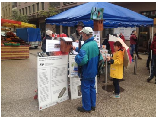
Stand au marché de La Chaux-de-Fonds