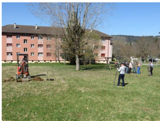
Journée médiatisée de la plantation d'arbres dans le quartier Beau-Site.

- Quartier locatif : l'expérience est très positive et permet de couvrir une large zone en une seule opération. Les discussions ont nécessité environ 18 mois (au moins 3 séances de travail avec préparation de document, ainsi qu'un accompagnement rapproché sur le terrain). La réceptivité est cependant susceptible d'être très différente d'un quartier à l'autre.