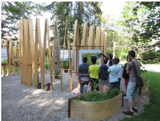
Animation avec visite de l'exposition