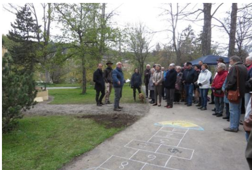
Discours d'inauguration de l'exposition