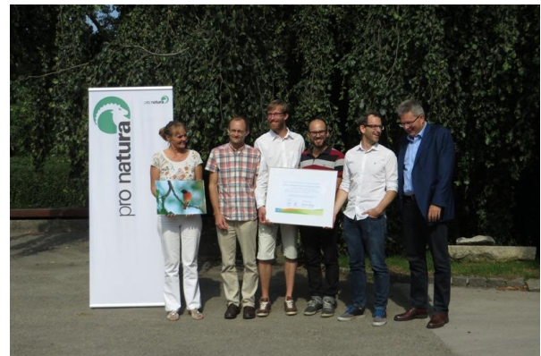
Remise du Prix Beugger 2016