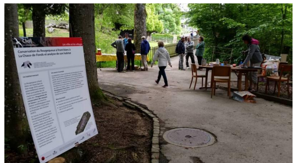
Journée du Rougequeue à front blanc