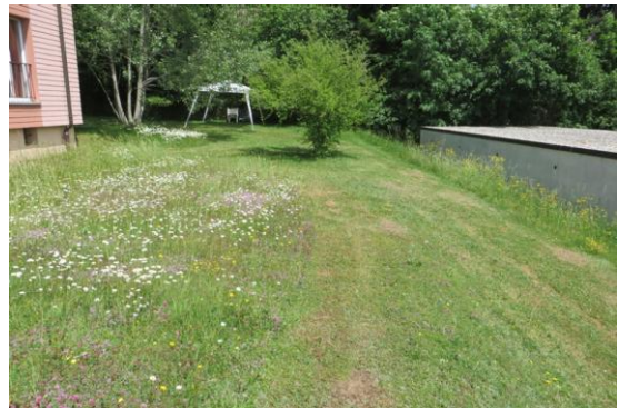
Mise en place d'un entretien différencié d'un gazon au quartier Beau-Site

La mise en place du réseau écologique vert en ville de La Chaux-de-Fonds demande notamment la plantation d'arbres dans les espaces ouverts le permettant. Des plantations ont été possibles chez un propriétaire dans le quartier de la Prairie (maisons individuelles) et dans le quartier de Beau-Site (immeubles locatifs en copropriété). Ces actions font suite aux actions de sensibilisation et d'information (chapitre 1).