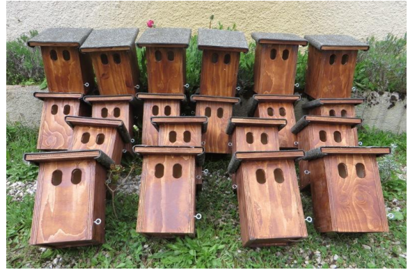
Type de nichoirs posés dans les jardins