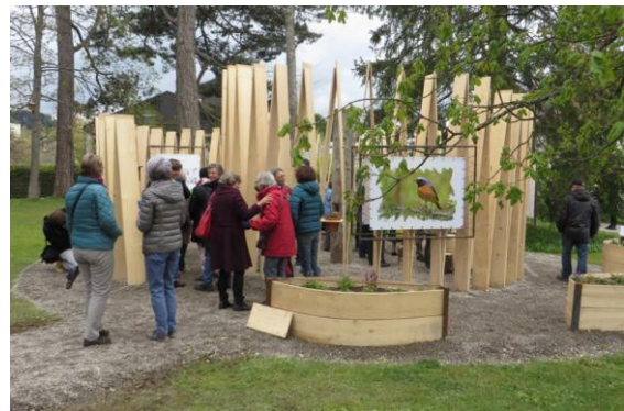
Inauguration de l'exposition « Sous l'aile du rougequeue à front blanc »

Une part très importante du projet consiste à l'appropriation de celui-ci par les citoyens, via l'emblème du Rougequeue à front blanc. Un effort d'information (documentations, communiqués de presse, visibilité médiatique...) a donc été mis en place au fil des actions menées. La sensibilisation, axée sur la biodiversité en ville, se fait en parallèle avec la mise à disposition de documents et de conseils adéquats, notamment lors de l'exposition ou la tenue de stands.